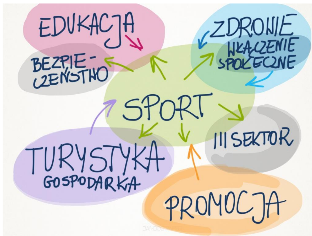
Rys. 1 Obszary oddziaływań sportu.

Pierwszym etapem procesu zmiany w obszarze sportu w Mrągowie było uświadomienie sobie jego znaczenia i wpływu na wiele sfer życia społecznego. Z perspektywy władz samorządowych na sport należy patrzeć, jako na obszar ściśle zintegrowany z turystyką, edukacją, zdrowiem, gospodarką, integracją społeczną, wzmacnianiem trzeciego sektora i promocją danej miejscowości. Wewnętrznie sport też składa się z powiązanych ze sobą, różnorodnych sfer i wynikających z nich działań: sportowych nawyków i doświadczeń mieszkańców, siły organizacji pozarządowych (klubów i organizacji sportowych), wsparcia dla trenerów i sportowców, dostępu do infrastruktury i sprzętu, polityki samorządowej, systemów szkoleniowych, współpracy międzynarodowej. Pokazuje to mnogość aktorów z wielu poziomów społecznej organizacji i wiele mechanizmów, które współtworzą sytuację sportu.